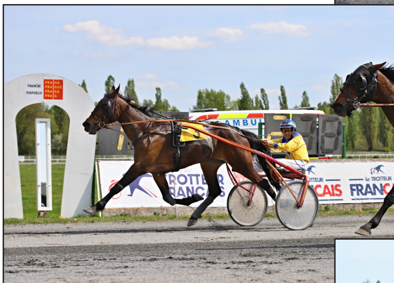
Naska OV (D) a Höwings Butterfly (D)